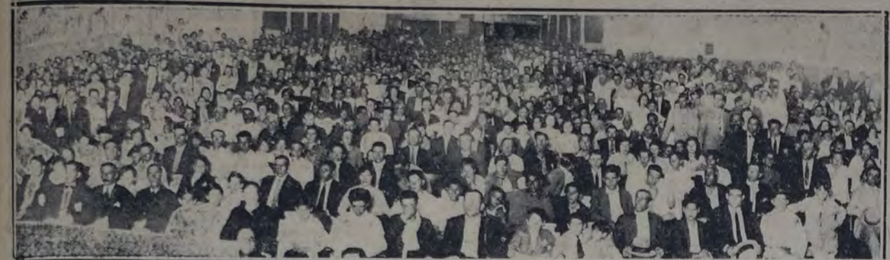
ASPECTO QUE PRESENTABA EL CINE-TEATRO ALBERDI LA NOCHE QUE FUERON PROCLAMADOS LOS CANDIDATOS A DIRECTORES obreros de la Caja Municipal de Jubilaciones que sostiene la "Unión Obreros Municipales"

Refiriéndose a la labor que desarrollarán los representantes de la Unión Obreros Municipales en el caso de ser electos, afirmó que ella se ajustaría al reglamento de antemano aceptado,